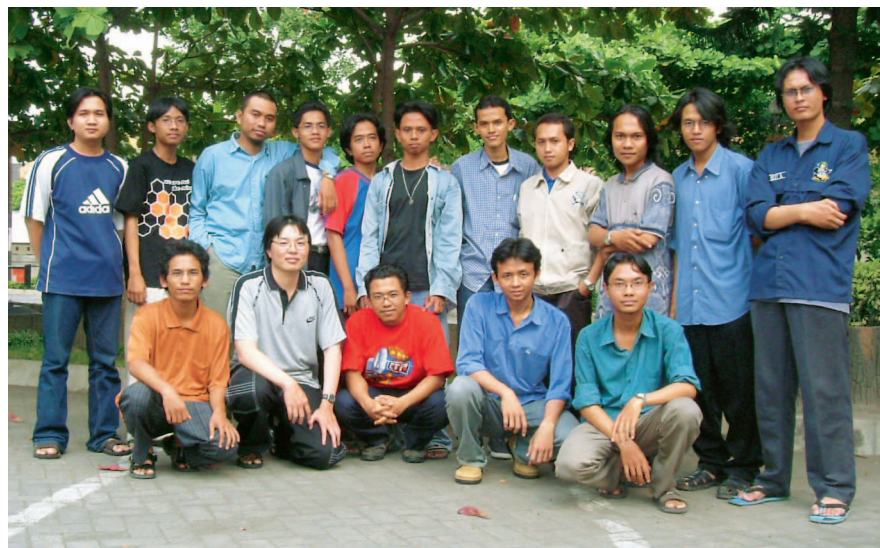
▲ Sebagian anggota KPLI Jogja.